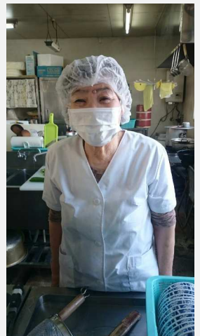
マスク外せばいいのに・・・